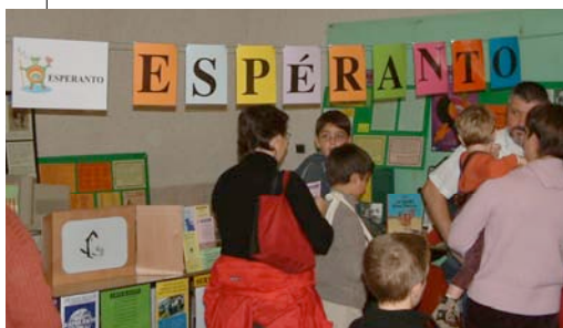
Les enfants ont une attirance naturelle pour l'espéranto dont ils comprennent très vite l'aspect logique.

Qu'attendons-nous pour l'offrir aux enfants ?