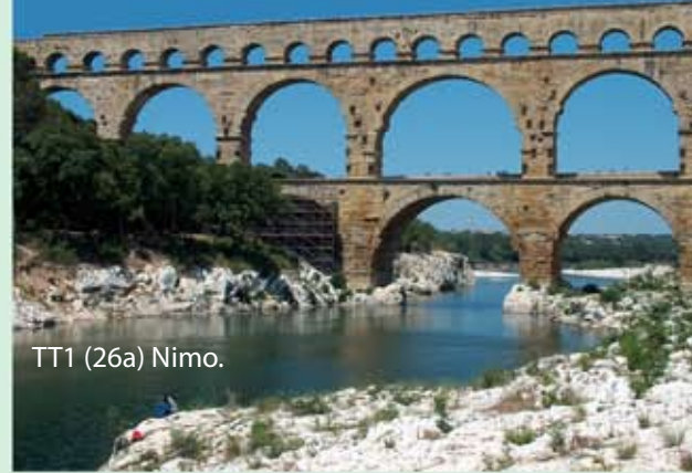
TT1 (26a) Nimo.