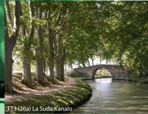
TT3 (26a) La Suda Kanalo