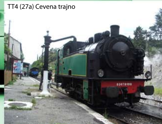
TT4 (27a) Cevena trajno