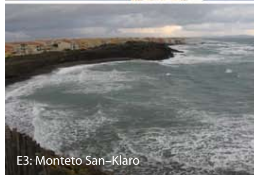
E3: Monteto San-Klaro