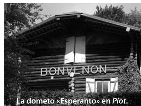
La dometo «Esperanto» en Piot.

Isabelle Jacob isabellejacob@voila.fr 05 55 03 54 76