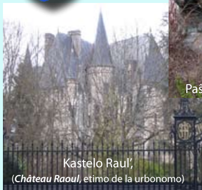
Kastelo Raul', ( Château Raoul , etimo de la urbonomo)