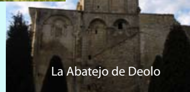
La Abatejo de Deolo